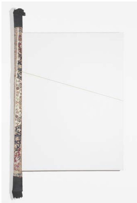
RENATO RANALDI Fuoriquadro, 2011 Tela, tondino di ottone e tappeto cm 200 x 100