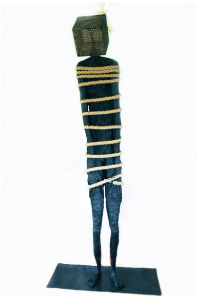
Lui , 2017 Bronze, fer H : Cm 220

En révélant les chaînes qui verrouillent nos corps et notre pensée, l’artiste nous aide à nous en affranchir. Elle nous rend notre liberté d’être et de nous exprimer. Telle cette Femme zippée dont le corps, les lèvres, la personne entière sont traversés de fermetures éclairs. Elle attend, silencieuse, celle ou celui qui saura « l’ouvrir », la rendre à elle même.