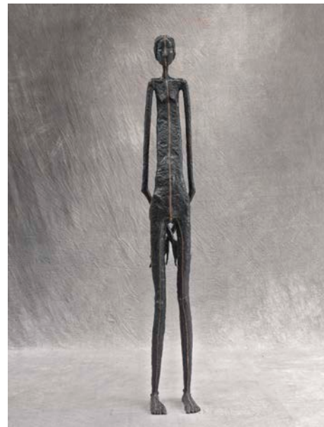
Elle , 2011 Bronze Cm 220 x 52 x 35 1/3